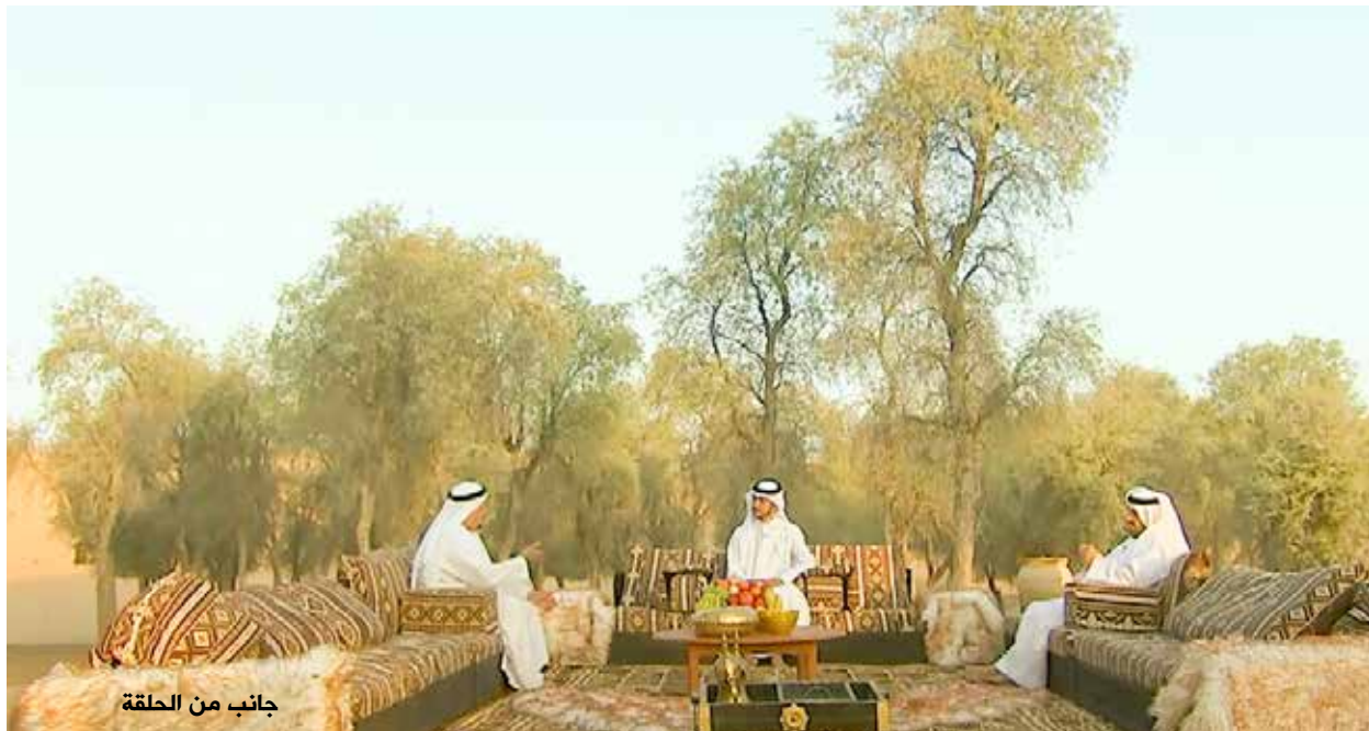
جانب من الحلقة

وتدخل الراوي راشد علي الكتبي قائلاً: «ومن الأمور العجيبة أن صاحب الناقة يعرف ناقتة من بين النوق مهما كانت النوق، كما أن الناقة تعرف صاحبها أيضاً والمكان الذي نشأت فيه مهما ابتعدت عنه، وفي ذلك قصصٌ كثيرة لا تحصى ولا تعد.»